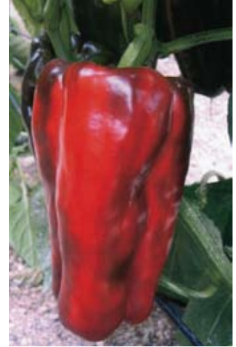
De Ruiter Semillas